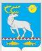
СХЕМА ТЕРРИТОРИАЛЬНОГО ПЛАНИРОВАНИЯ АНАДЫРСКОГО РАЙОНА ЧУКОТСКОГО АВТОНОМНОГО ОКРУГА