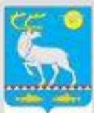
СХЕМА ТЕРРИТОРИАЛЬНОГО ПЛАНИРОВАНИЯ АНАДЫРСКОГО РАЙОНА ЧУКОТСКОГО АВТНОМНОГО ОКРУГА

СХЕМА РАЗВИТИЯ ИНЖЕНЕРНОЙ ИНФРАСТРУКТУРЫ