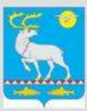
СХЕМА ТЕРРИТОРИАЛЬНОГО ПЛАНИРОВАНИЯ АНАДЫРСКОГО РАЙОНА ЧУКОТСКОГО АВТОНОМНОГО ОКРУГА СХЕМА РАЗВИТИЯ СИСТЕМЫ ЖИЗНЕДЕЯТЕЛЬНОСТИ КОРЕННЫХ МАЛОЧИСЛЕННЫХ НАРОДОВ СЕВЕРА МАСШТАБ 1:500 000