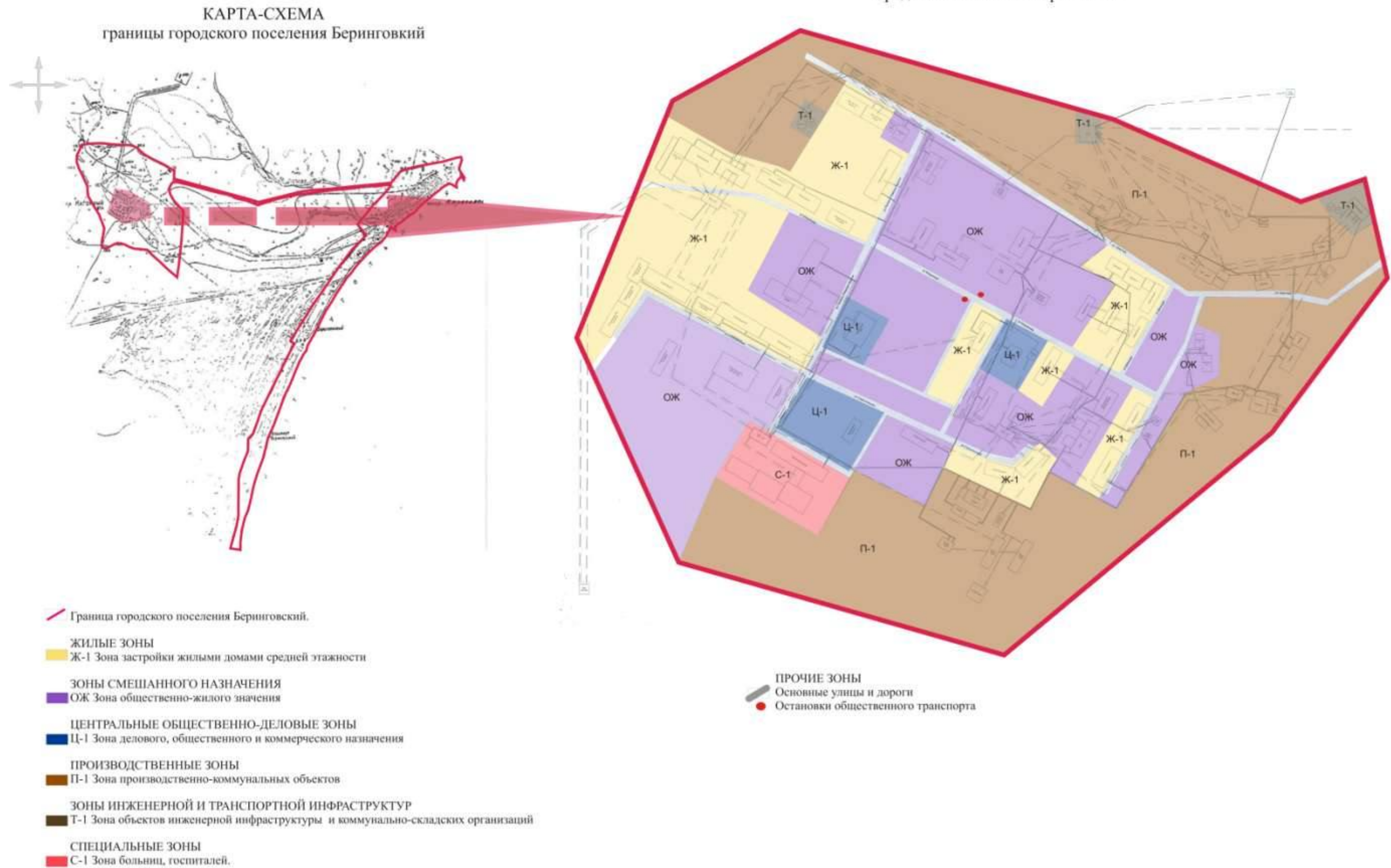
Схема градостроительного зонирования городского поселения Беринговский

Статья 46. Схема градостроительного зонирования городского поселения.