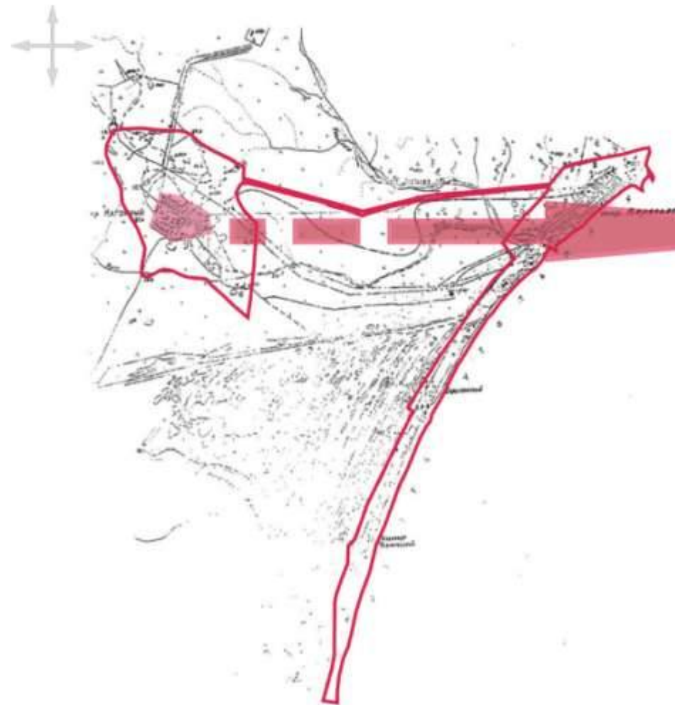
КАРТА-СХЕМА границы городского поселения Беринговский